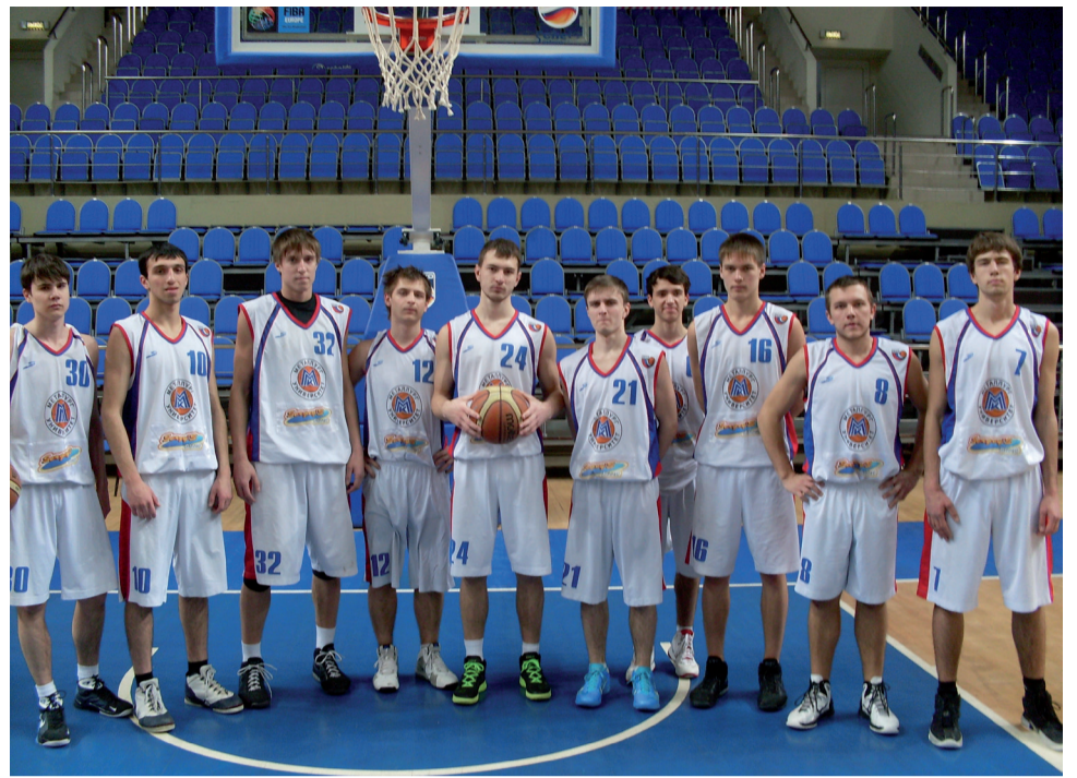
Юношеская баскетбольная команда

Сейчас тренеры ставят своим подопечным новую задачу – попасть в призовую тройку, чтобы продолжить игры