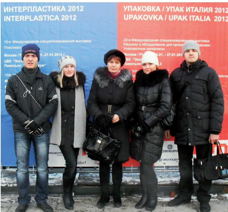
На выставке в «Экспоцентре» на Красной Пресне

В свою очередь, ребята ознакомились с достижениями предприятий в области разработки современных упаковочных материалов, посмотрели новейшее оборудование. Благодаря таким вы-