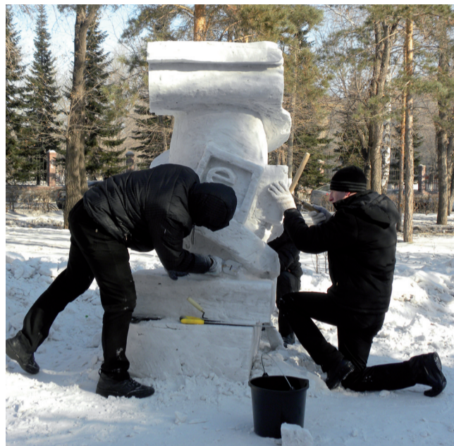
Работает команда «Лидер», 2 место