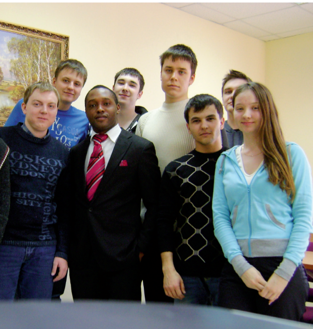
Наша группа на «Погружении»

Отдельно нужно рассказать о том, как мы катались на коньках. Самое важное то, что Паскаль до этого ни разу не катался, но мы быстро его научили! К нам подъезжали ребята и спрашивали о нем, пытались поговорить, но разговор получался несвязным, мы поправляли их. Это незабываемо, ког-