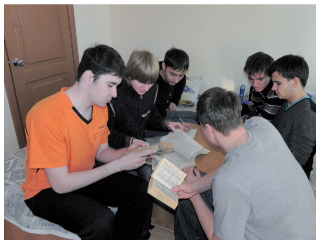
Выполняем домашнее задание

Я очень довольна этими 8 днями и интересными занятиями, где мы разыгрывали различные сценки и сходу импровизировали. Это просто великолепно, почта надо устраивать такое нашим студентам!