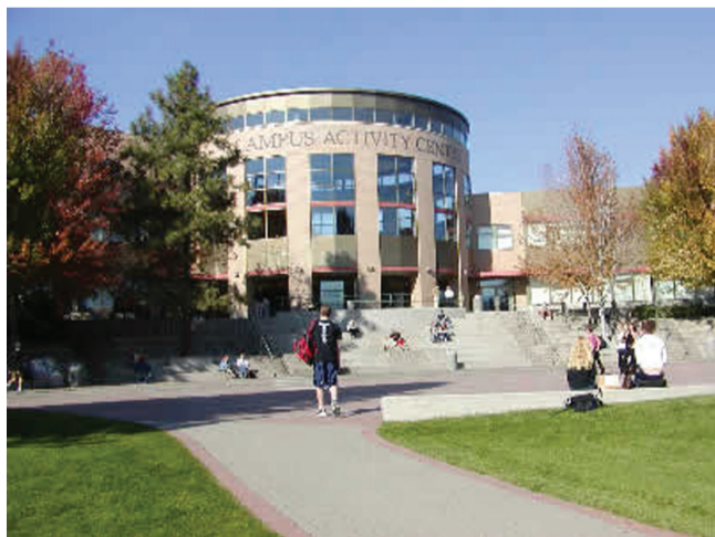
Томпсон риверз университет (Thompson Rivers University)

В 2010 году мне удалось поехать в США по программе обмена на лето. В этом мне помогли очень многие люди,