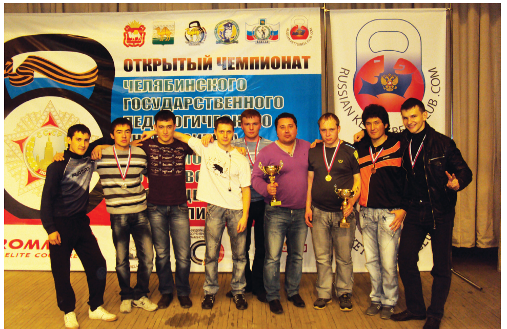
Серебряные призеры по гиревому виду спорта среди студентов

Первые областные соревнования прошли два года назад, и наш вуз занял тогда 17 место, в прошлом году мы поднялись уже на 11 место. В этом году на соревнованиях в с. Миасское, проходивших в марте, мы уже выходили на 4 место, а сейчас мои подопечные – серебряные призеры. Они уступили только Челябинскому государственному агроинженерному университету. Это вполне объяснимо. Здесь в основном учащиеся сельские ребята. А гиревый вид спорта очень бурно развивается именно в селах. Не случайно и соревнования проводятся в районах. Например, в прошлом году эти соревнования проходили в селе Миасское. Отрадно, что мы обошли Уральский государственный университет физической культуры, который завоевал бронзовые медали.