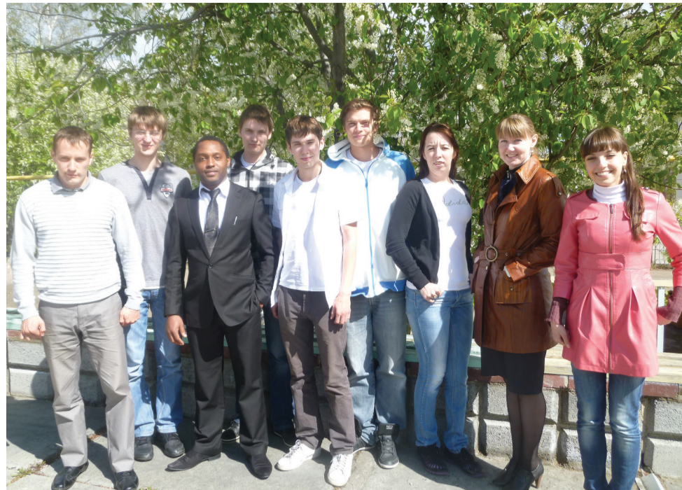
В учебно-оздоровительном центре «Юность»