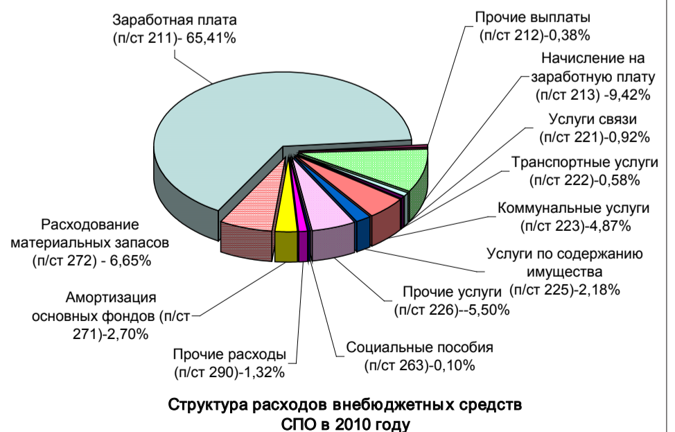
Структура расходов внебюджетных средств СПО в 2010 году