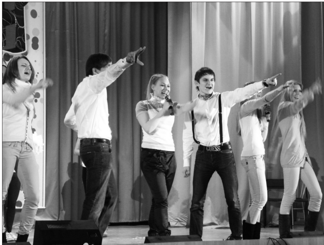
Мы начинаем КВН

Из года в год состав жюри на играх КВН почти не меняется: большинство – руководите-