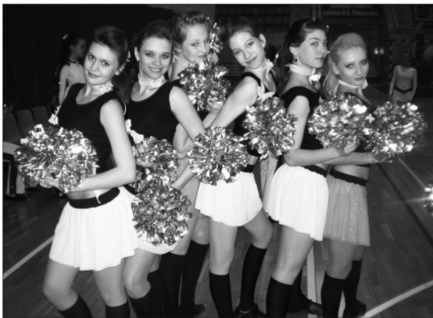
Группа поддержки «Металлург-Университет»

С самых первых выступлений детских команд было видно, что за прошедший год в профессиональном плане подросли все – и тренеры, и спортсмены. И в результате – хорошо подготовленные программы и качественное исполнение наи-