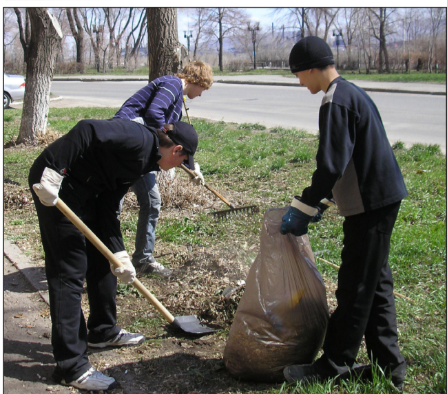
Группа 8-1 на субботнике