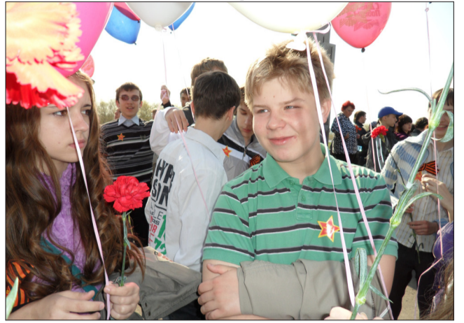
С Днём Победы!