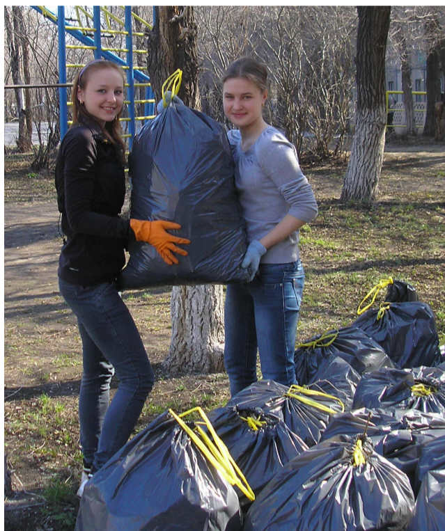
Рекорд группы 9-3: собрано 53 мешка мусора!

– Лично я принимаю участие в акции не в первый раз, и с каждым разом становится все интереснее. Добавляют много нового в процесс проведения акции. Надеюсь пойти ещё раз, думаю, что будет так же оригинально и весело.