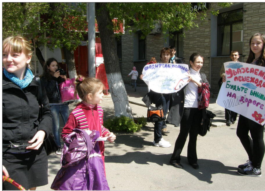
Правила движения не для нарушения!

*** Традиционная акция «Молодежь за безопасность на доро-