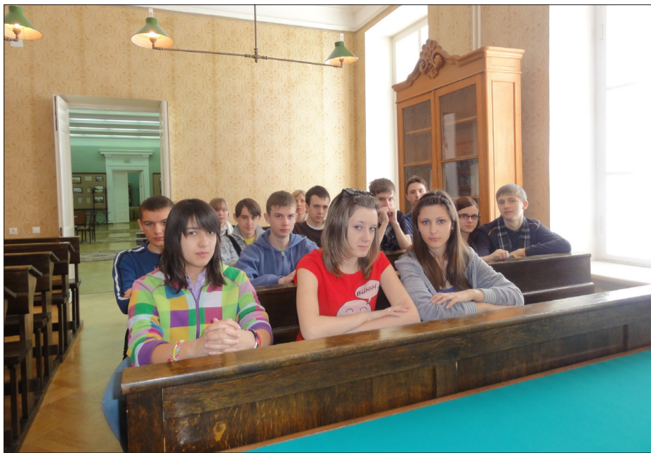
Мы за партами Казанского университета

Адрес редакции и издателя: пр. Ленина, 38, ауд. 248. Тел.: 29-85-36, 85-36. e-mail: denniza@magtu.ru Отпечатано ЗАО «Магнитогорский Дом печати», г. Магнитогорск, пр. К. Маркса, 69. Распространяется бесплатно в г. Магнитогорске Челябинской области.