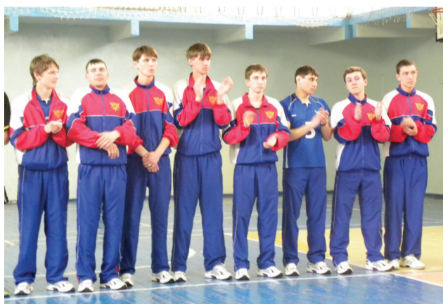
Команда многопрофильного колледжа

24 марта стартовало финальное Первенство Челябинской области по волейболу среди юношей, реализующих программы специалитета среднего звена. Попросту говоря, ФИНАЛ СПО!!!