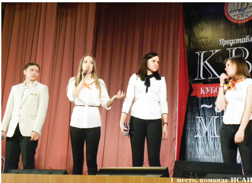
1 место, команда ИСАИ

Большой актовый зал нашего университета 13 марта был забит до отказа. Восемь команд КВН разыграли «Кубок ректора 2014» среди первокурсников. В этот раз игра была посвящена предстоящему 80-летию вуза.