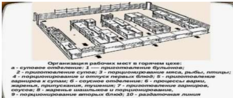
Рис. Организация рабочих мест в горячем цехе

Зарисуйте схему расположения оборудования в суповом и соусном отделениях горячего цеха.