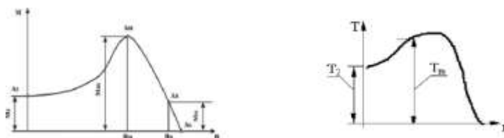
Рисунок 8 – График зависимости