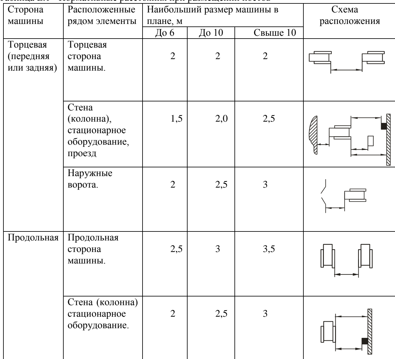
Таблица Е.1 - Нормативные расстояния при размещении постов