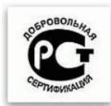
Рисунок 4 – Знак соответствия при добровольной сертификации

Знак соответствия – обозначение, служащее для информирования приобретателей о соответствии объекта сертификации требованиям системы сертификации.