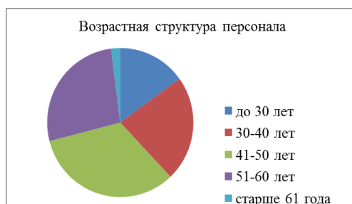
Рис. 1. Возрастная структура персонала

– «Возрастная структура по категориям персонала», пример на рис. 2: