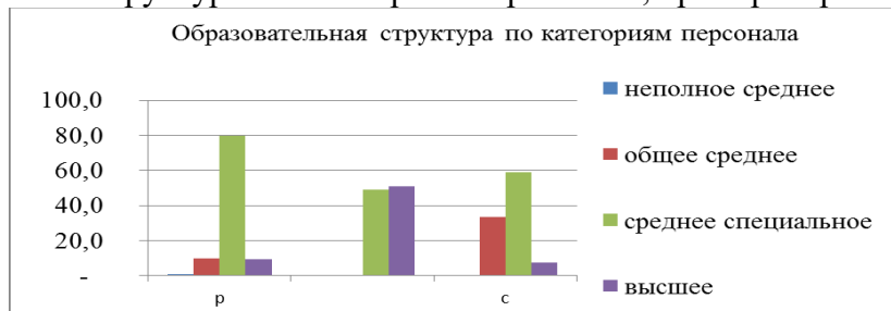
Рис. 4. Образовательная структура по категориям персонала

– «Образовательная структура по категориям персонала», пример на рис. 4: