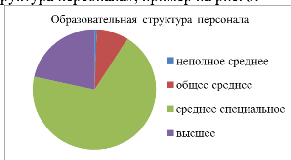
Рис. 3. Образовательная структура персонала

– «Образовательная структура персонала», пример на рис. 3: