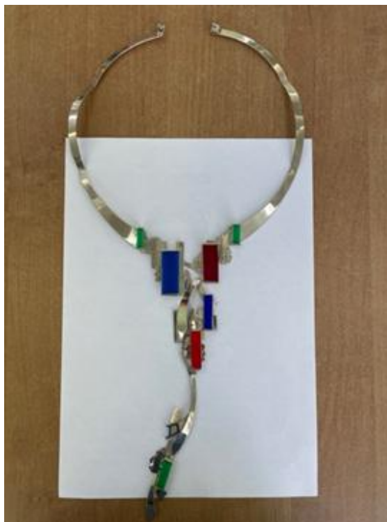
Рисунок 2. Итоговый вариант колье «Город» после проведения ремонтно-реставрационных мероприятий