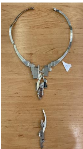
Рисунок 1. Исходное состояние колье «Город» с обнаруженными дефектами

3. Из поверхностных загрязнений: поверхность покрыта небольшим слоем пыли.