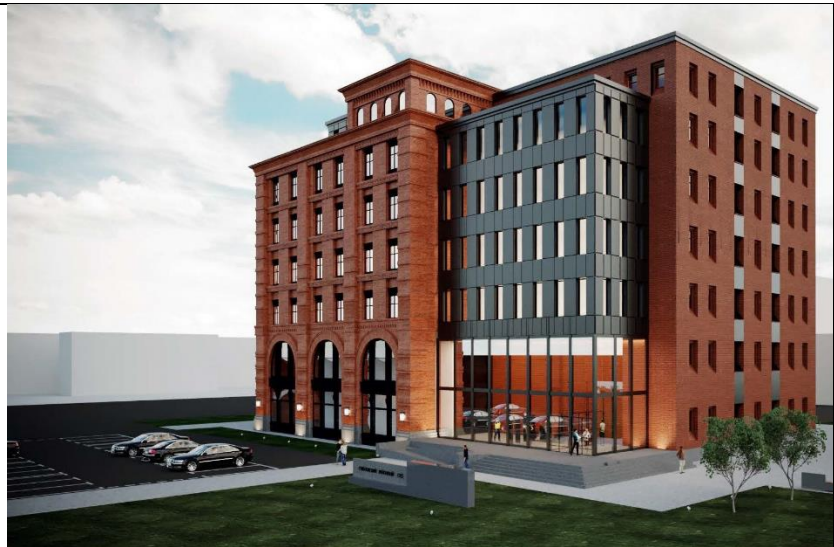
Рисунок 1 – Пример тестового изображения