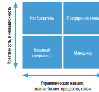
Рис. Матрица «Креативность – управленческие навыки»