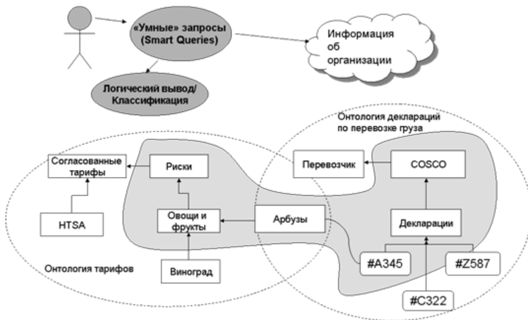
Рисунок 3 Интеллектуальный поиск на основе логического вывода