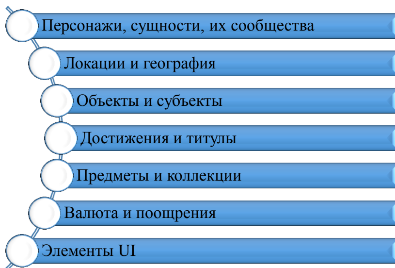
Рисунок 1. Категории терминов глоссария игры

Основные категории терминов, которые необходимо описать в глоссарии игры приведены ниже (рисунок 1).