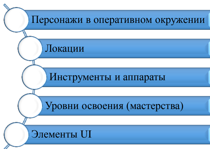
Рисунок 2. Категории терминов глоссария виртуального тренажера

От этого количество категорий может увеличиться. Примерная категоризация приведена на рисунке 2.