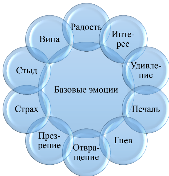
Рисунок 1. Система базовых эмоций по К. Изарду

Каждая из фундаментальных эмоций лежит в основе целого спектра состояний, различающихся по степени выраженности. Из их соединения рождаются чувства (рисунок 2).