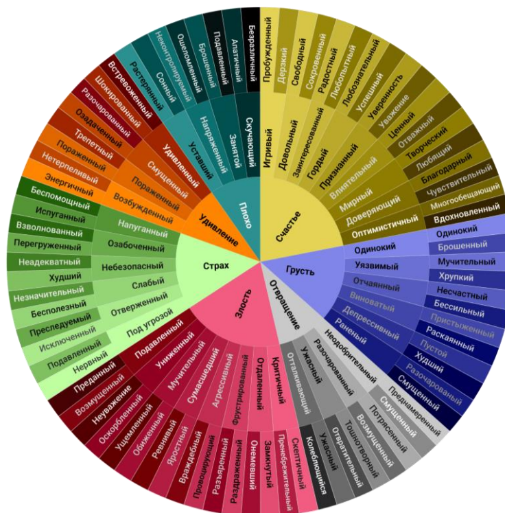
Рисунок 2. Спектр чувств, основанных на базовых эмоциях

Каждая из фундаментальных эмоций лежит в основе целого спектра состояний, различающихся по степени выраженности. Из их соединения рождаются чувства (рисунок 2).