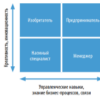
Рис. Матрица «Креативность – управленческие навыки»

3. Проанализируйте и сравните, какое влияние на существующие рынки оказывают радикальные (базисные) и улучшающие (поддерживающие) инновации. Охарактеризуйте инновации, приведенные ниже, в зависимости от глубины вносимых изменений: