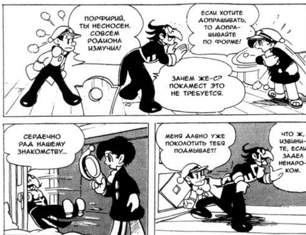
Рисунок А.1 – Манга О. Тэдзуки «Преступление и наказание». Эпизод «Порфирий пришёл в комнату Раскольникова»

Примечание: за выполнение технических требований к оформлению ВКР отвечает студент! Научный руководитель, проводит проверку на соответствие техническим требованиям перед подготовкой итогового варианта работы к передаче на проверку нормоконтролеру кафедры.