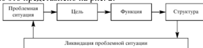
Рис.2. Возникновение целей

• Цель представляет собой состояние, к которому направлена тенденция движения объекта. В неживой природе существуют объективные цели, а в живой дополнительно - субъективные цели. Образно говоря, объективная цель - это мишень для поражения, а субъективная цель - желание стрелка поразить ее. Цель обычно возникает из проблемной ситуации, которая не может быть разрешена наличными средствами. И система с присущей ей или частично измененной структурой и функцией выступает средством разрешения проблемы. Схематично это представлено на рис. 2.