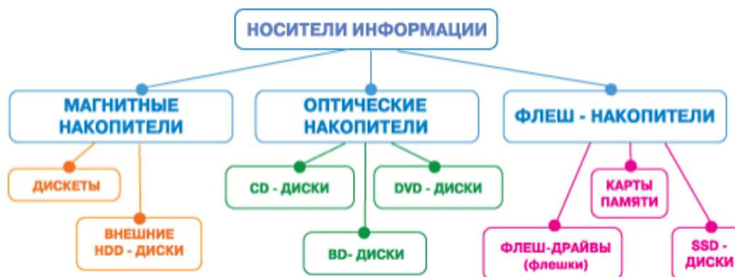
Рисунок 1- Классификация носителей информации

Флеш-накопители, карты памяти, переносные жесткие диски: