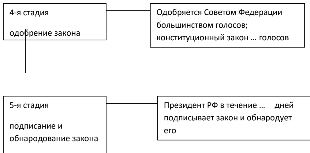
Схема 1. Стадии законодательного процесса на уровне Федерального Собрания