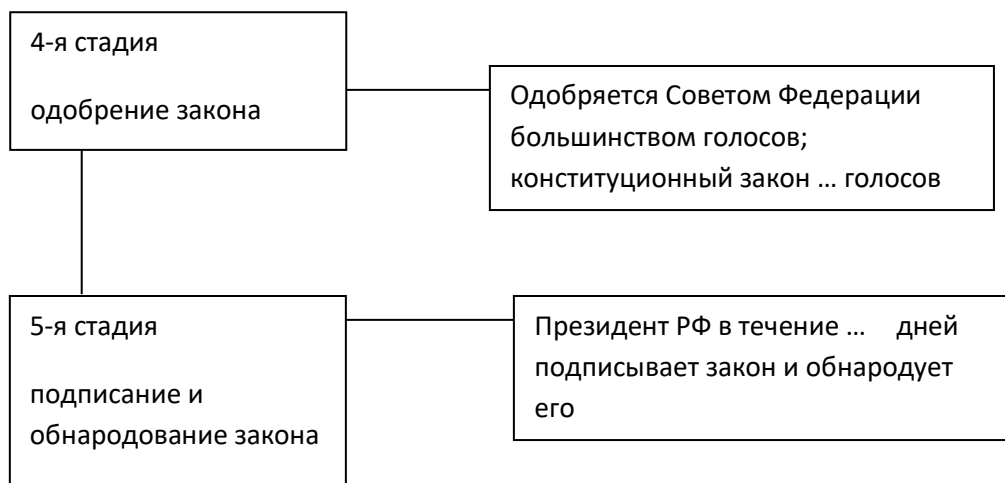
Схема 1. Стадии законодательного процесса на уровне Федерального Собрания