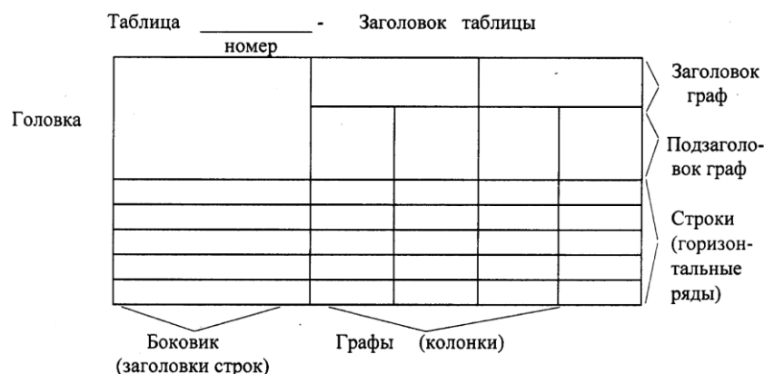
Рис. 1. Пример оформления таблицы

Название таблицы, при его наличии, должно отражать ее содержание, быть точным, кратким. Название таблицы помещают над таблицей после ее номера через тире, с прописной буквы (остальные строчные), без абзацного отступа. Надпись «Таблица...» пишется над левым верхним углом таблицы и выполняется строчными буквами (кроме первой прописной) без подчеркивания.