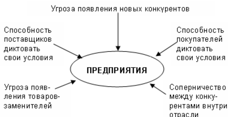
Рис. Модель 5-сил М. Портера

В основу теории положено утверждение, что прибыльность предприятия определяется не внешним видом и характеристиками производимой продукции и не уровнем технологии, а структурой отрасли. На рис. 5.1. приведены основные факторы, воздействующие на предприятия.