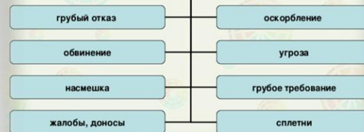
Уровень вербальной агрессии в зависимости от возраста