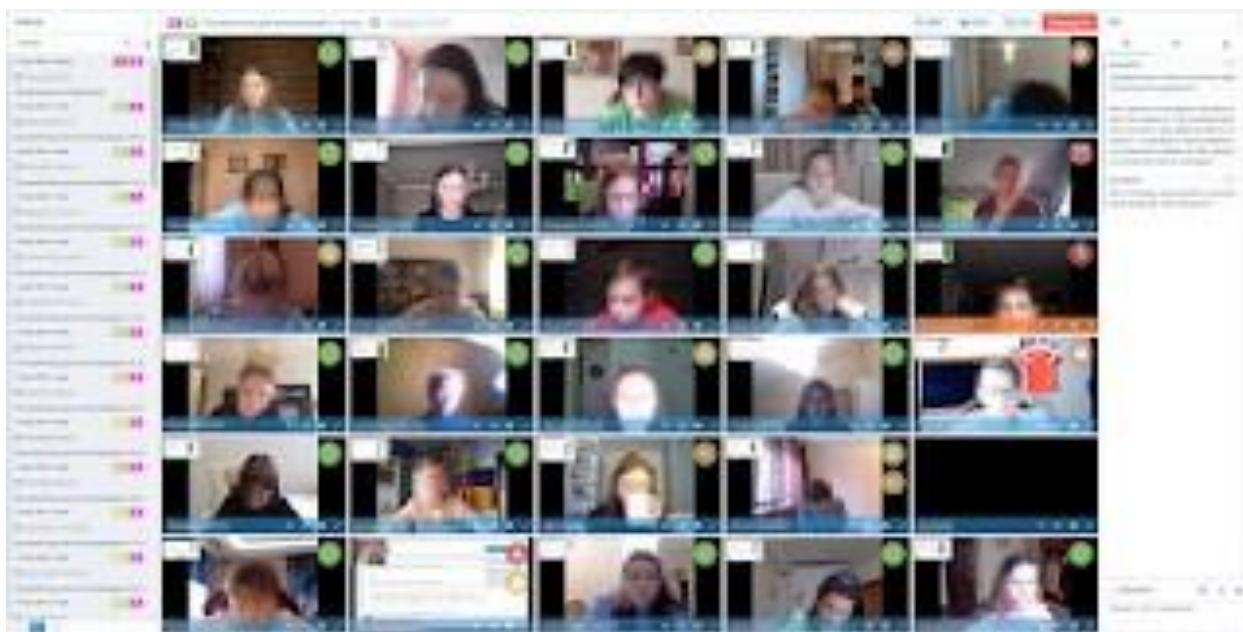
Рисунок 2 — Интерфейс наблюдения

Каждый проктор может наблюдать до 10 сеансов одновременно (рисунок 2). Чем мощнее компьютер и быстрее интернет, тем больше сеансов можно отобразить одновременно.