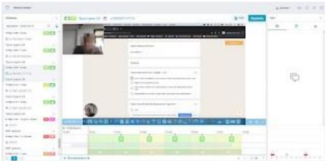
Рисунок 4 — Протокол сеанса

к протоколу сеанса (рисунок 4). Видеозаписи сеанса появляются в протоколе не сразу, а по мере их обработки. Обработка видеозаписей может занимать от 10 до 20 мин. в зависимости от продолжительности сеанса и числа одновременных сеансов в системе.